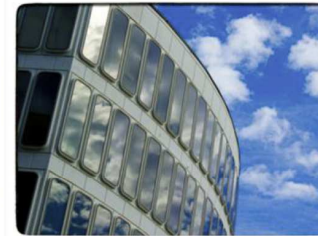
Palazzo Affari, sede degli uffici al pubblico