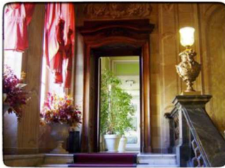
Palazzo Birago, sede istituzionale

territorio tracciabilità finanziamenti vigilare abilitazioni promuovere alternanza scuola-lavoro mercato idee formazione bandi digitale b2b innovazione start-up laboratori cultura borsa merci adempimenti dati imprese estero tecnologie ambiente tutelare social impact sostenere filiere prezzi economia certificazione giovani internazionalizzazione crescere ricerca partner mentoring studi creare orientamento registro imprese turismo